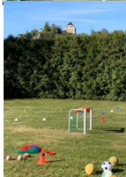
Bilder bzw. Impressionen rund um den Fußball beim KiGa-Frühlingsfest an der Jugendherberge in Hartenstein

Kurzzeitig ergaben sich Spiele im 3gegen3 und die angebotenen Leibchen, erfüllten – auf Grund der Farbe – sogar den Zweck eines Glubb- oder Bayerntrikots. Entsprechend gelungene Übungen, Beinschüsse und Torerfolge wurden von Jung und Alt teilweise überschwänglich bejubelt.