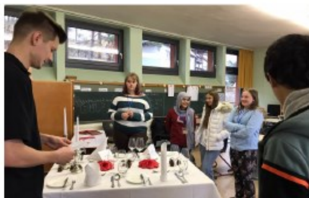
Berufswahlberatung ist wichtig – Berufsinfoblog 2023; Foto: V. Frauenknecht

Da der AG FrankenPfalz e.V. für die Broschüre mit dem Netzwerk SCHULEWIRTSCHAFT Pegnitz-Auerbach zusammenarbeitet, sind zudem Angebote aus dem Pegnitzer Raum enthalten.